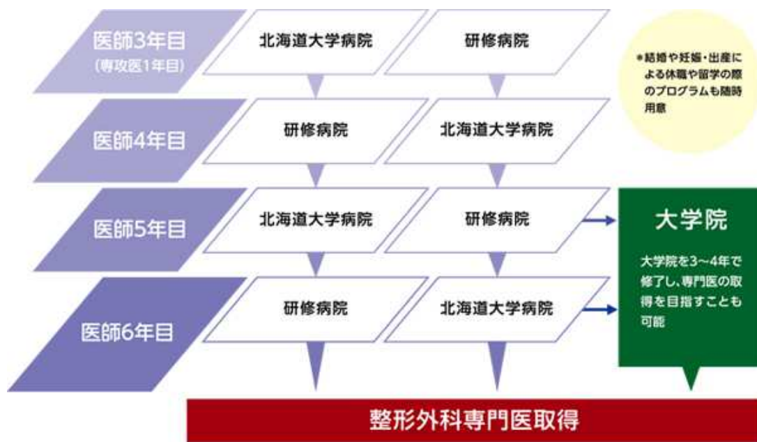
図 1. 北海道大学整形外科専門研修プログラム（研修期間：3年9か月間）